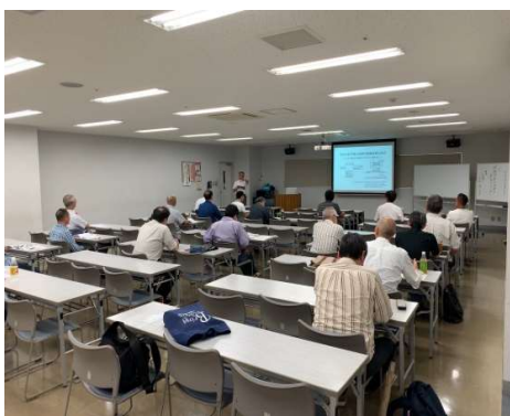
参加者で盛況の会場