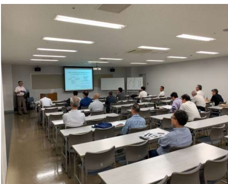
熱心に聞き入る参加者